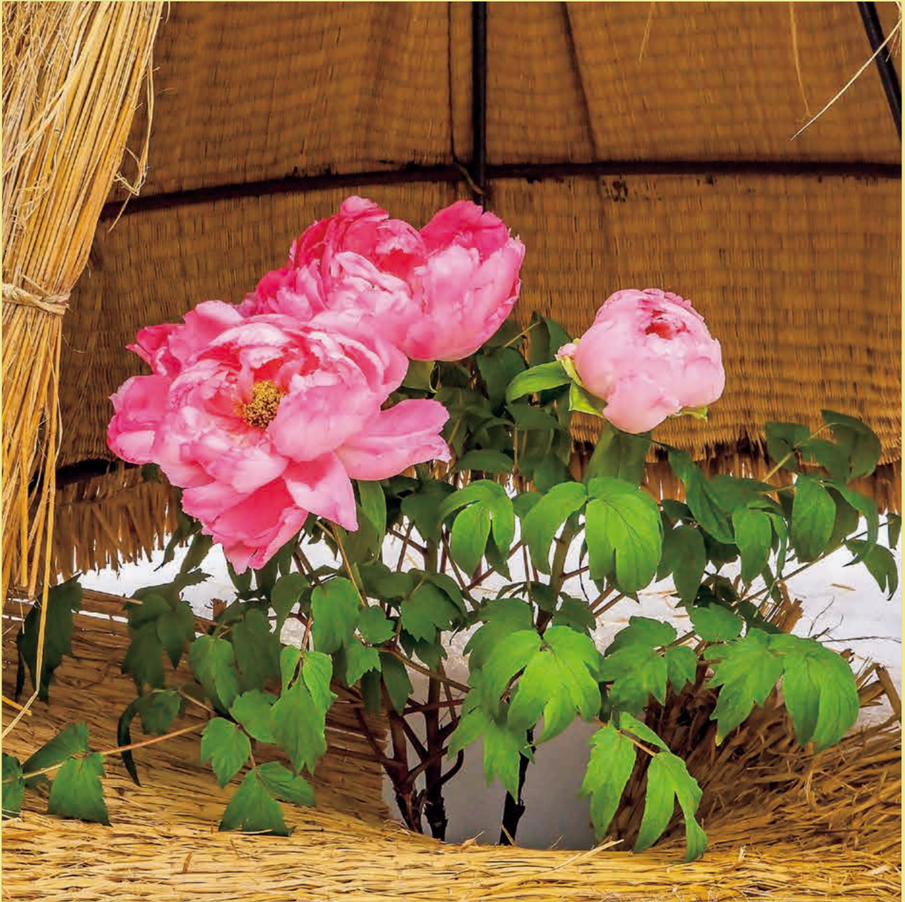
【牡丹】 高島町では「牡丹姫伝説」にちなんで2月上旬に「まほろば冬咲きぼたんまつり」が開催されます。