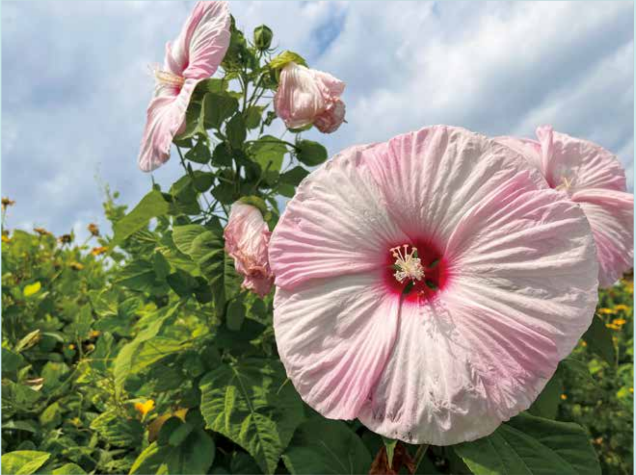
【タイタンピカス】 アオイ科フヨウ属の宿根草。 撮影場所：米沢市