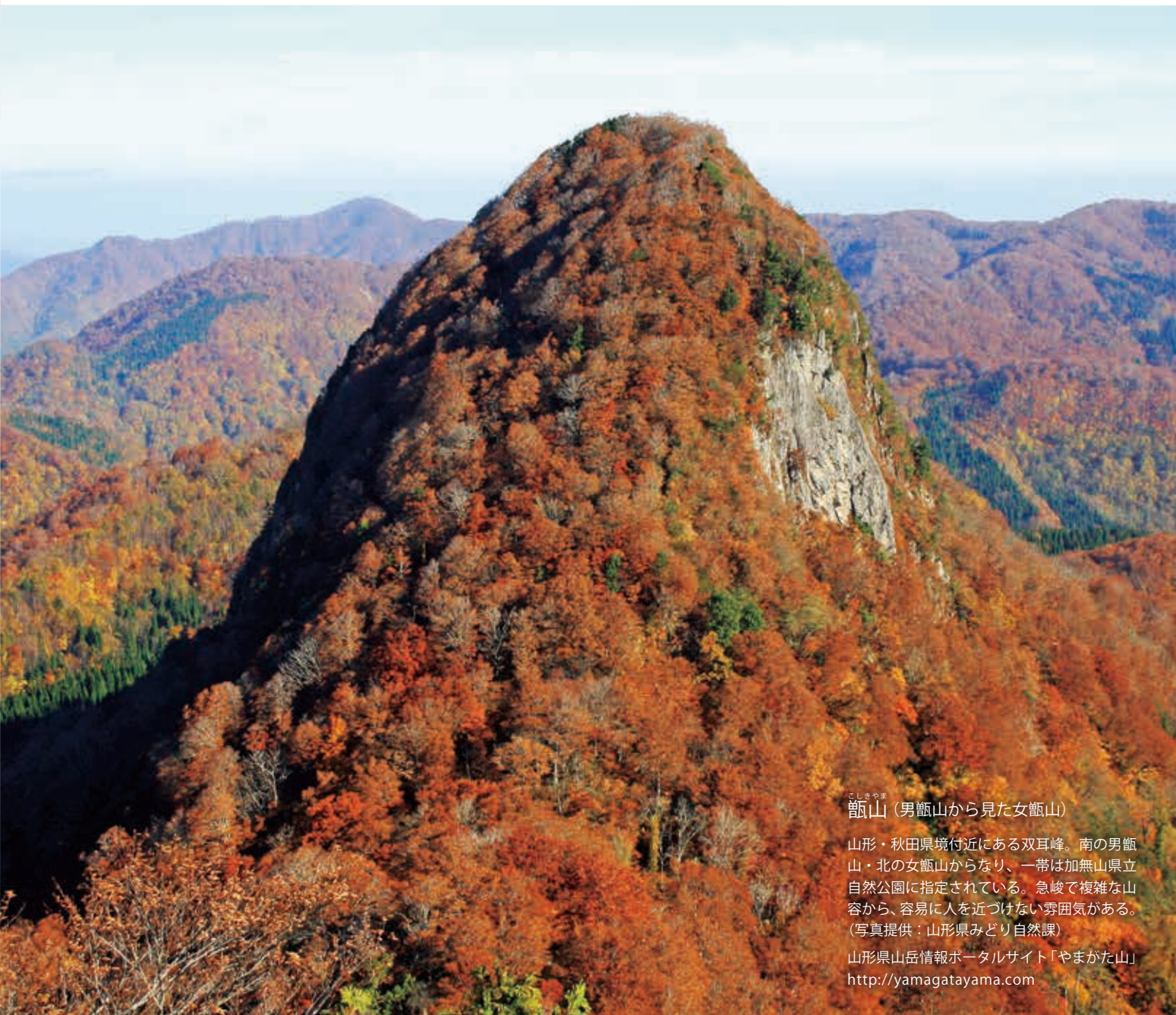
こしきやま 甌山 (男甌山から見た女甌山)

山形・秋田県境付近にある双耳峰。南の男甌山・北の女甌山からなり、一帯は加無山県立自然公園に指定されている。急峻で複雑な山容から、容易に人を近づけない雰囲気がある。